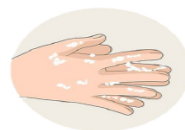
Je jette mon masque et je me lave les mains