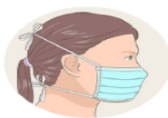
J'attache le bas de mon masque