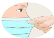
Je pince le bord rigide pour l'ajuster à mon nez