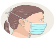
J'attache le haut de mon masque