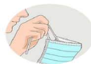
Pour le retirer, je ne touche que les attaches